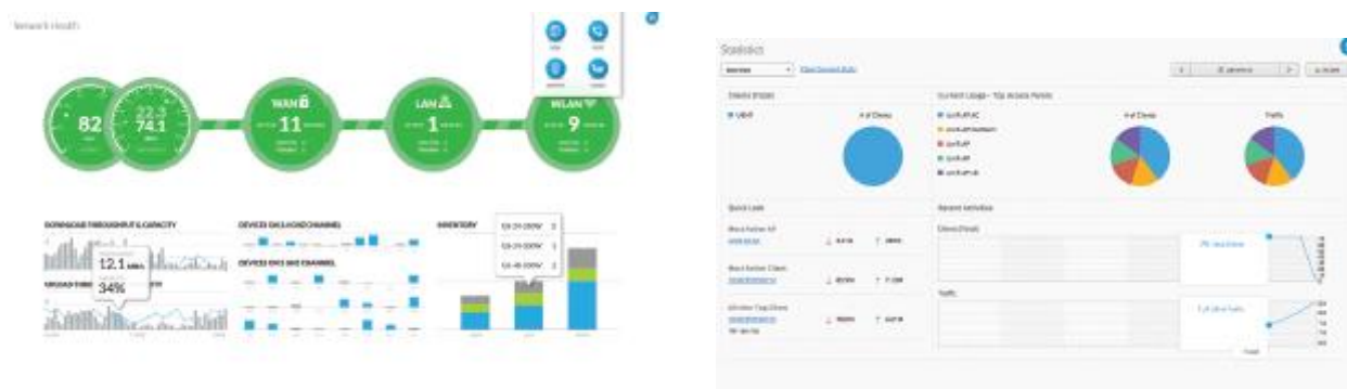
Obrázok: UniFi Dashboard